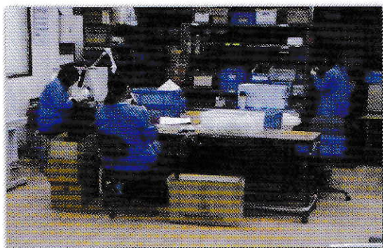
女性の働きやすい職場