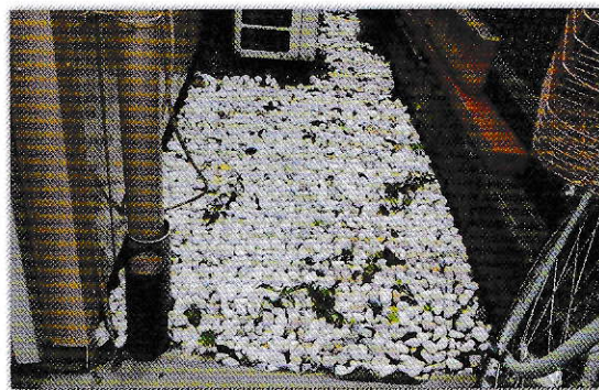
防犯用砂利の設置